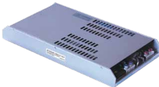
Рис. 3. Инновационный для российской техники высокоэффективный планарный AC/DC-модуль JETA3000-5000 с КПД выше 92% – основа для построения централизованных преобразователей матричных систем электропитания

Замечательным свойством рассматриваемого модуля является его планарность – профиль всей серии этих модулей (JETA2000, JETA3000, JETA5000) беспрецедентно мал – всего 38 мм; при этом можно утопить модули в тело радиатора еще на 6 мм. В таком случае они будут выступать над базовой плитой радиатора на высоту не более 32 мм! Другие подробности этой уникальной конструкции см. на [4].